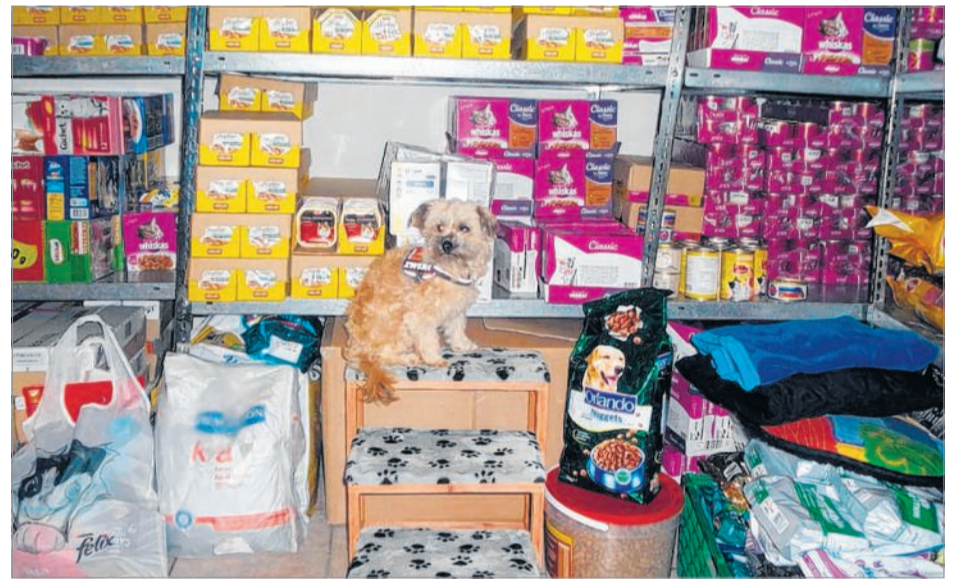
Üppig gefüllt sind die Regale in der Futterausgabestelle des Vereins Haustierhilfe. Hier finden bedürftige Tierhalter Unterstützung für ihre Lieblinge.

Auch die Miete für die Futterausgabestelle und Nebenkosten würden davon bestritten. Bekomme jemand Unterstützung bei den Tierarztkosten, werde das ebenfalls spendenfinanziert. Weitere Informationen zu den ehrenamtlichen Mitgliedern, Zielen und Aktionen des Vereins gibt es auf dessen Internetseite www.siegerlaenderhaustierhilfe.de .